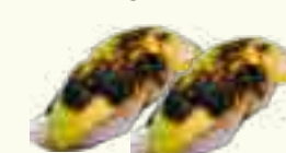
26 DAURADE ROYALE