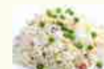
102 RIZ CANTONNAIS