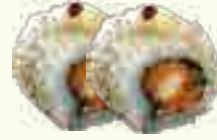
CH63 POULET PANNÉ CAROTTE