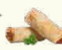
10 NEMS AU POULET 2 PIECES