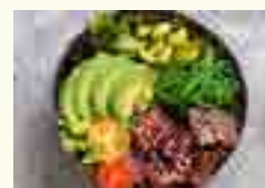
PO71 POKE BOWL THON