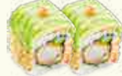
66 CREVETTE AVOCAT