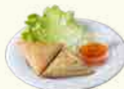
12 SAMOUSSA BOEUF 2 PIECES