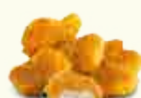
14 NUGGETS DE POULET