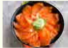
CS70 CHIRASHI SAUMON