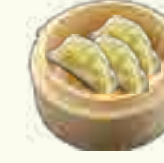
RA8 RAVIOLI AUX VAPEUR 3 PIECES