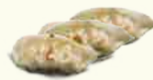
09 RAVIOLIS GRILLÉS 3 PIECES