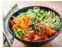
PO72 POKE BOWL SAUMON