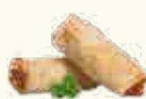
15 NEMS AU PORC 2 PIECES