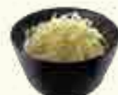
02 SALADE DE CHOU