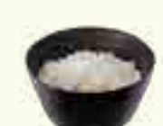
101 RIZ VIGNAIGRE