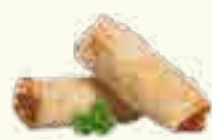
11 NEMS AUX CREVETTES 2 PIECES