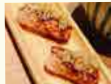
69 SUSHI SAUMON DEMI-CUIT