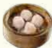
05 RAVIOLIS CREVETTES 3 PIECES