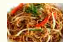
103 NOUILLE SAUTÉES AUX LÉGUMES