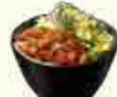
04 SALADE SAUMON AVOCAT