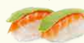
SA24 SAUMON AVOVAT