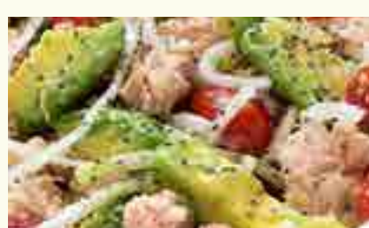
SA17 SALADE THON CUIT AVOCAT