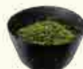
03 SALADE D'ALGUE