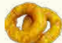
13 BEIGNET DE CALAMAR 2 PIECES