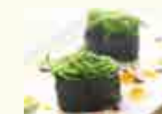
SA35 SUSHI ALGUE