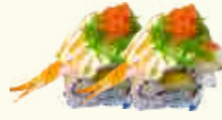
67 MAKI CREVETTES ROYALE