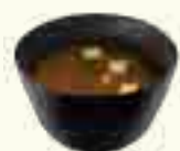
01 SOUPE MISO