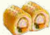
65 CREVETTES ALGUE