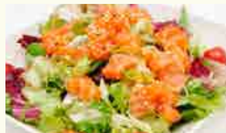
SA16 SALADE SAUMON AVOCAT