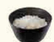
100 RIZ NATURE