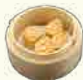
06 BOUCHÉE AUX CREVETTES 3 PIECES