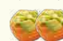
27 SUSHI AVOCAT