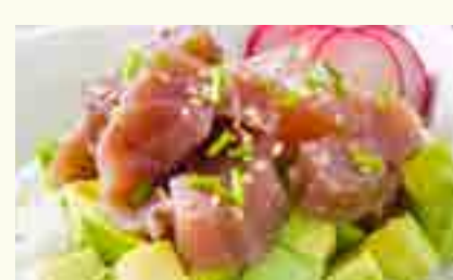
SA18 SALADE THON AVOCAT